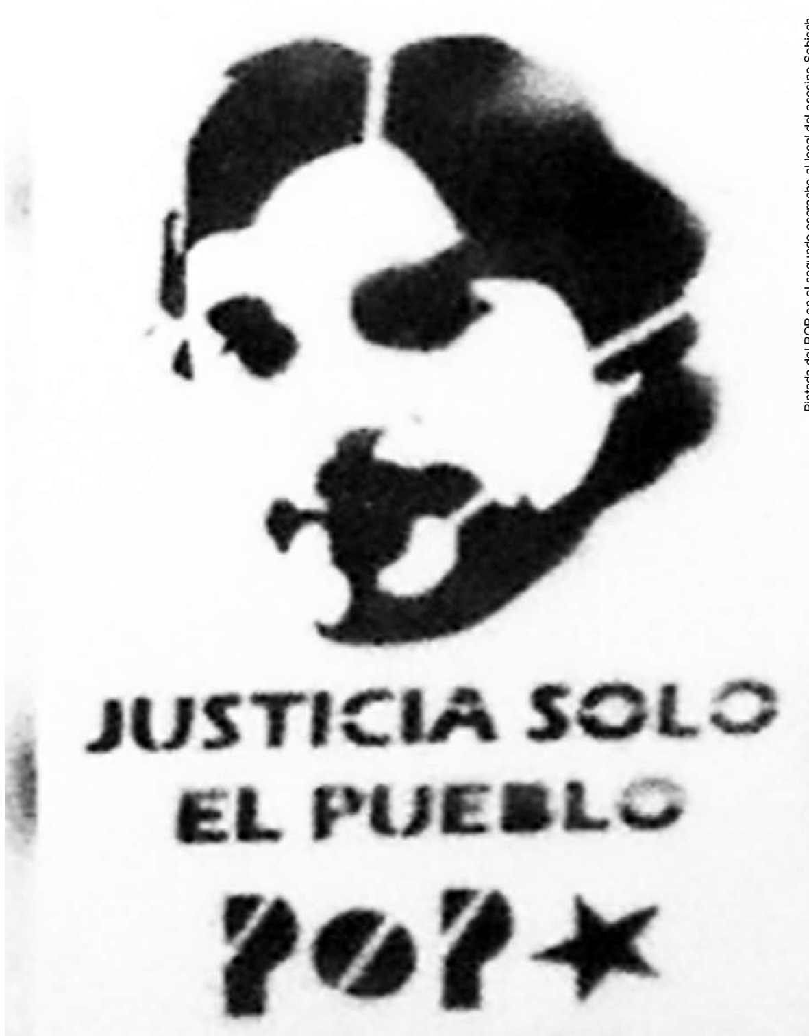
Pintada del POP en el segundo escrache al local del asesino Sobisch.